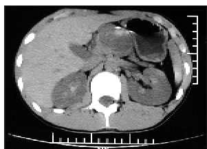
图 1 CT 显示肿瘤位于胰腺体部、有钙化

患儿, 男, 13 岁, 因腹痛 3 d 伴呕吐入院, 无发热。起病以来, 大小便正常, 无腹部外伤史。体查: 上腹略偏左有一直径约 5 cm 包块, 质硬, 无波动感, 移动度差, 轻压痛。彩超提示上腹部不均质性包块 (不排除胰腺占位)。CT 检查提示胰腺体部有一类圆形低密度肿块影, 直径约 4 cm, 边界较清晰, 肿块边缘见斑点状高密度钙化 (图 1), 考虑为胰腺实性假乳头状瘤。血癌胚抗原 0.72 ng/mL, 糖类抗原 CA199 7.14 U/mL。于入院后第 5 天行手术治疗, 术中见肿瘤位于胰体部, 约 4 cm × 4 cm × 5 cm 大小, 包膜尚完整 (图 2), 予胰体部及肿瘤完整切除, 胰尾部与空肠作 Roux-Y 吻合。术后予营养支持, 患儿病情平稳, 顺利恢复, 未出现胰漏、胆汁漏和肠漏等, 术后 3 个月复查血糖、血脂、血淀粉酶、尿淀粉酶等均正常, 术后病理检查结果为胰体部实性假乳头状瘤伴出血、坏死 (约 6 cm × 4.5 cm × 3 cm 大小), 瘤细胞大小较一致, 弥漫性片状排列见假乳头结构, 出血坏死明显, 间质黏液样变, 局部钙化。免疫标记: a - ACT + , a - AP + , PR + , NSE + , Vim + , Syn + , CEA - , CA199 - 。