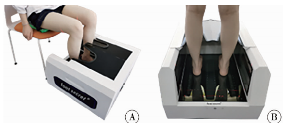
注 A:非负重状态(坐姿); B:负重状态(站立)

二、足弓指数、足弓体积以及足弓柔韧度的测量使用“Foot Secret”三维全足扫描仪测量非负重状态(坐姿)和负重状态(站立)时的足部参数(图 1)。该扫描仪采用主动式立体视觉三维技术,采用红外光学三角成像原理,对参与者的眼睛安全无害。输出的足部三维模型采用标准格式(stl/obj/asc)导出到三维设计软件中。